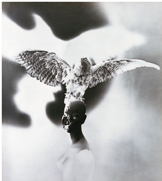
Stane Jagodič , Gluhonema bolečina, 1971, asemblaž-foto, last Moderne galerije Ljubljana