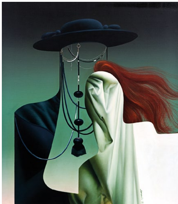
Avgust Lavrenčič , Poročna slika , 1980, olje/platno, last Centra sodobnih umetnosti Celje