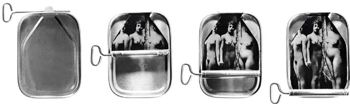
Stane Jagodič , Ravnati pazljivo!, 1972, sekvence I., III., V., VI., objekt-montaža-foto