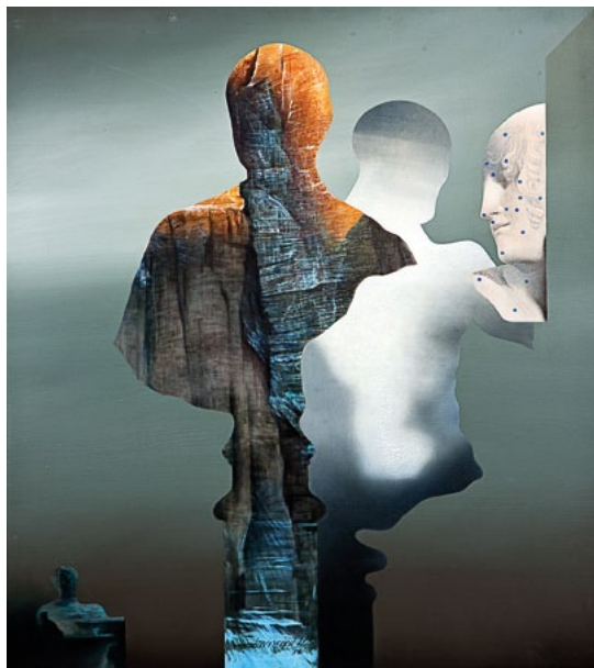
Avgust Lavrenčič , Lapidarijci, 1981, olje/platno, last Centra sodobnih umetnosti Celje