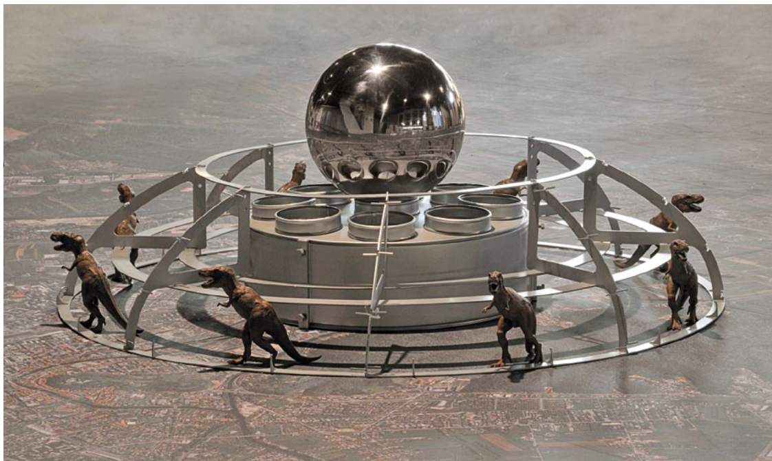
Stane Jagodič, Nucleus, 2007, asemblaž

Pred sabo imamo torej dela avtorjev, ki v svojevrstnem likovnem jeziku skrbita za materializacijo zapletenih mentalnih stanj, hkrati pa za brezhibno vizualno čitljivost podobe. Medtem ko je eksaktni videz vseh pojavnih oblik v Lavrenčičevih slikah pogojen z raziskavami barvnih, svetlobnih in prostorskih dognanj v postopku izrazitega lazurnega slikarstva ter veristično naslikanih detajlov v procesu ploskovnih razrezov in izrezov, so Jagodičevi objekti, asemblaži, kolaži in fotomontaže, strukturirani po principu plastenja in/ali montaže v nove poetične sestave iz že obstoječih materialov/ objektov in drugih stranskih produktov potrošništva. Orientacija Jagodičeve umetnosti se torej bolj kot nadrealističnih vzorcev (prebiramo jih le v simbolni vrednosti) dotika konstruktivističnih. Tudi zgodovinske izkušnje De Chiricove metafizike so neznatne. Bolj od tega je čutiti dadaistični absurd (Duchamp) v njegovih »ready made-ih«. Vendar pa bi vsako pretirano sklicevanje na evropske zgodovinske avantgarde zameglilo pomen njegove umetnosti, kajti le-ta