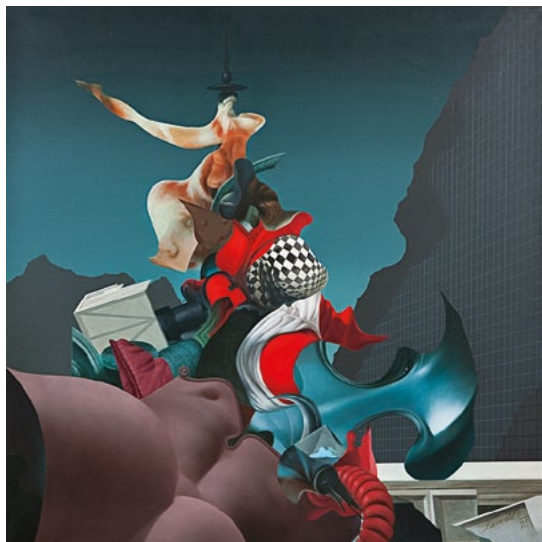
Avgust Lavrenčič , Deponija, 1986, olje/platno, last Centra sodobnih umetnosti Celje