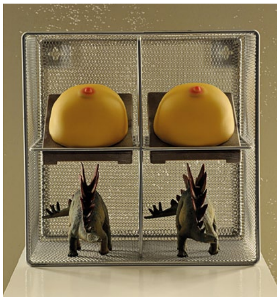
Stane Jagodič , Bordel, asemblaž, 2007