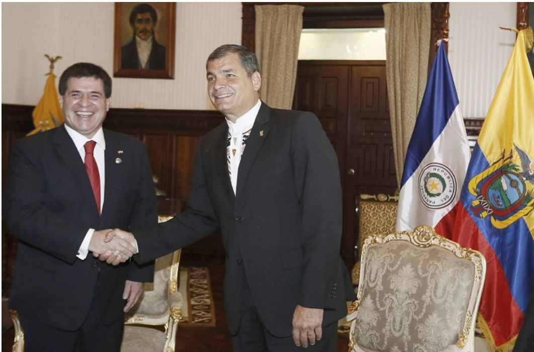
Imagen 1. Presidente del Paraguay Horacio Cartes con su colega el Presidente Rafael Correa de la República del Ecuador en el Palacio de Carondelet, 21 de Noviembre del 2014.