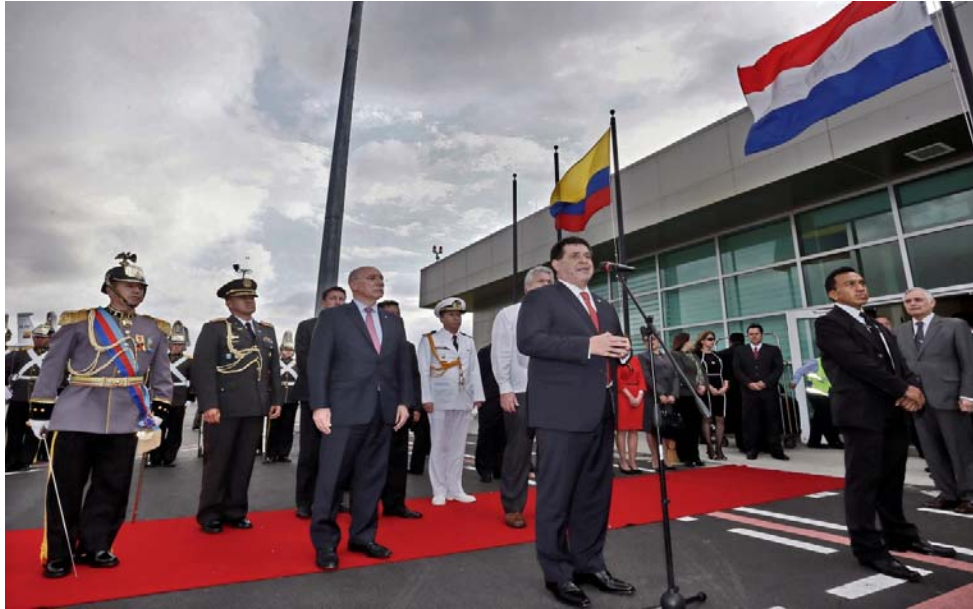
Imagen 3. Presidente Horacio Cartes llegando en el Aeropuerto Mariscal Sucre en Quito, Ecuador.