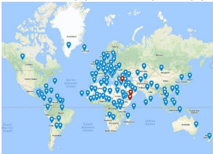
Amerika ima vojne baze u 149 država svijeta